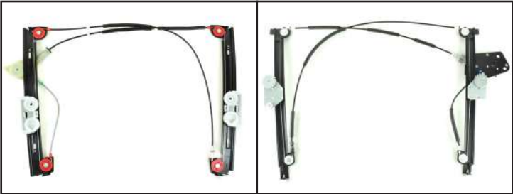
Alzacristallo originale - oem window regulator - lève-vitre original - Fensterheber von oem - elevalunas original - levantator de vidro original - orijinal cam acacagi - Γρύλος γνήσιος Nostro alzacristallo - our window regulator - notre lève-vitre - unser Fensterheber - nuestro elevalunas- nosso levantator de vidro - bizim cam acacagi - Γρύλος γνήσιος